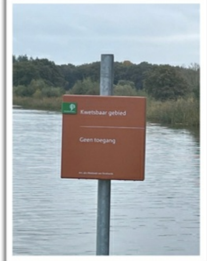
Foto: bord Staatsbosbeheer

Met de mededeling “ kwetsbaar gebied, geen toegang ” is het voor alle belangstellenden duidelijk wat nu de bedoeling is. Alleen nog een beperkt aantal leden van de visvereniging mag (al vissend, buiten het broedseizoen) op het Ven komen