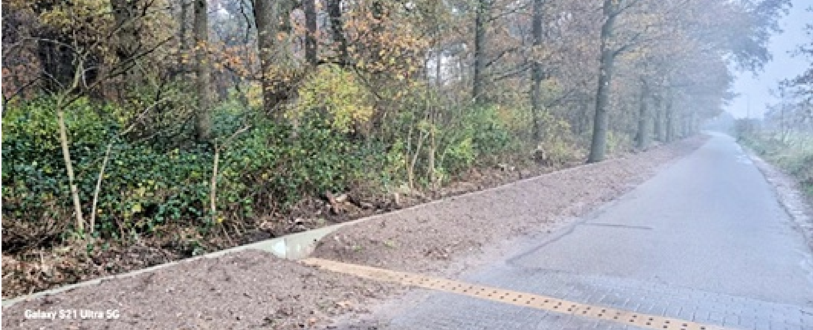
Foto: nieuwe paddenschermen Boskant

De Gemeente Wijchen heeft nieuwe betonnen paddenschermen geplaatst langs de Zandbergseweg, in het buurtschap Boskant. De oude kunststof schermen werden regelmatig kapotgereden door tractoren en ander groot materieel. De familie Bufo is er blij mee (Bufo is de Latijnse naam voor de gewone pad) maar ook kikkers en salamanders maken er gebruik van.