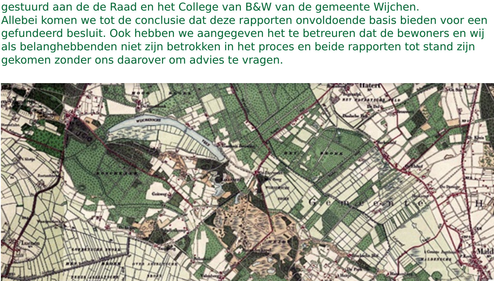
Afbeelding: Topo tijdreis, Alverna 1925

De gemeente Wijchen heeft twee onderzoeken laten doen op basis waarvan ze principemedewerking zou verlenen aan de plannen. Een onderzoek naar de verkeersontwikkeling en een onderzoek naar de gevolgen voor de natuur. Natuur Wijchen en Vrienden van de Vennen hebben de twee rapporten geanalyseerd en een reactie gestuurd aan de Raad en het College van B&W van de gemeente Wijchen. Allebei komen we tot de conclusie dat deze rapporten onvoldoende basis bieden voor een gefundeerd besluit. Ook hebben we aangegeven het te betreuren dat de bewoners en wij als belanghebbenden niet zijn betrokken in het proces en beide rapporten tot stand zijn gekomen zonder ons daarover om advies te vragen.