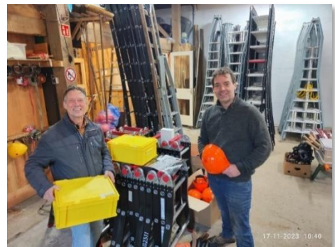
Veilig Werken.

Ook voor vrijwilligers is arbeidsveiligheid belangrijk en moeten de werkmaterialen aan Arbo-eisen voldoen. In 2023 hebben we dankzij subsidie van de gemeente Wijchen, het Cultuurfonds en Vraag en aanbod nieuwe ladders en veiligheidshelmen kunnen aanschaffen bij Landschapsbeheer Gelderland (SLG). Verder hebben we nu een takel voor het kerk- en steenuilenteam om de nestkasten veiliger omhoog te takelen en een up to date EHBO-kist. SLG zorgt bovendien dat de ladders, helmen etc. jaarlijks Arbo-gekeurd worden.