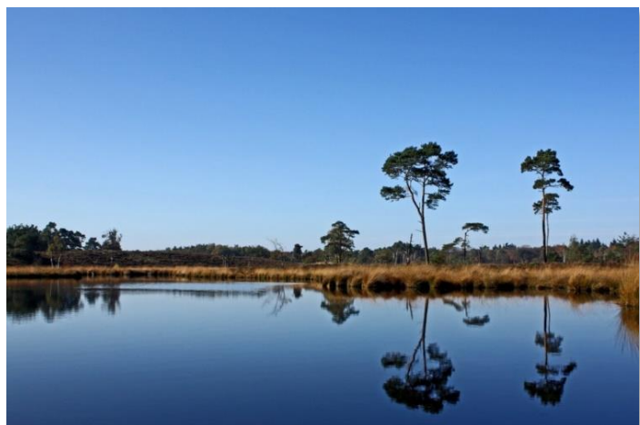
Hatertse en Overasseltse vennen.