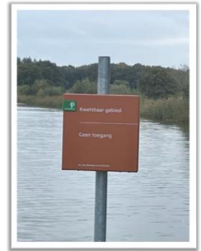
Wijchens Ven.

Met een eerste succes. Wij zijn blij dat Staatsbosbeheer definitief een vaarverbod heeft ingesteld voor het Wijchens Ven. Met de mededeling “kwetsbaar gebied, geen toegang” op de borden is het voor alle belangstellenden duidelijk wat nu de bedoeling is.