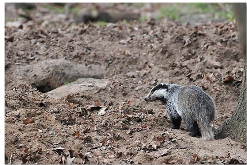
Das bij burcht.

Een nieuw ecologisch veldonderzoek is nodig om hier meer duidelijkheid over te geven. Verder hebben we aangegeven dat de evenementen zoals de Viking run onder strenge voorwaarden apart vergund moeten worden. Deze activiteiten vinden namelijk voor een aanzienlijk deel buiten het terrein van de Berendonck plaats, met grote impact op het nabijgelegen vennengebied.