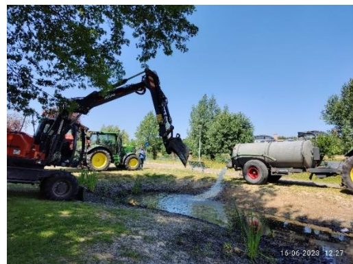
Redden amfibieën bij Diepvoorde.

Vanwege de langdurige droogte afgelopen voorjaar dreigde een poel bij de Diepvoorde droog te vallen. Juist een poel die honderden kleine watersalamanders en kikkers bevat. We hadden de natuur zijn gang kunnen laten gaan, maar dat konden we niet over ons hart verkrijgen. Als een poel aan het eind van de zomer droogvalt komen de salamanders wel weg, maar deze waren nog te jong. Na veel ambtelijk overleg is de gemeente Wijchen te hulp geschoten. Met graafmachines is een stuk van de poel uitgegraven en aangevuld met speciaal schoonwater. Hierdoor hebben we het aantal klimaatslachtoffers kunnen beperken.