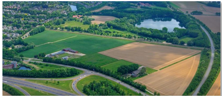
Locatie Wijchen West

De plannen die er nu liggen moeten nog door de Provincie goedgekeurd worden, voordat met de bouw gestart kan worden. Wij houden de vinger aan de pols en zien erop toe dat de plannen zorgvuldig uitgevoerd worden en waar mogelijk zelfs win-win kansen benut worden.