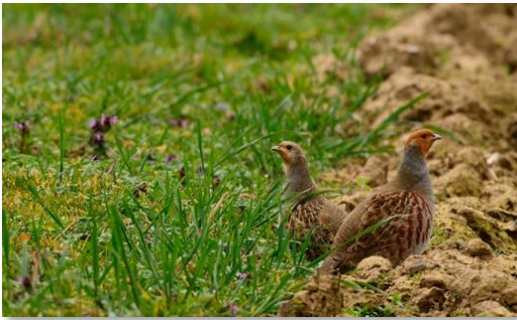
Patrijzen tellen.

Jaarlijks worden in heel Wijchen de patrijzen geteld. Door de intensieve landbouw hebben deze akkervogels het heel moeilijk. Mede dankzij de enthousiaste tellingen in Wijchen komen er vanuit de Provincie extra maatregelen om de patrijzenstand in Wijchen te vergroten.