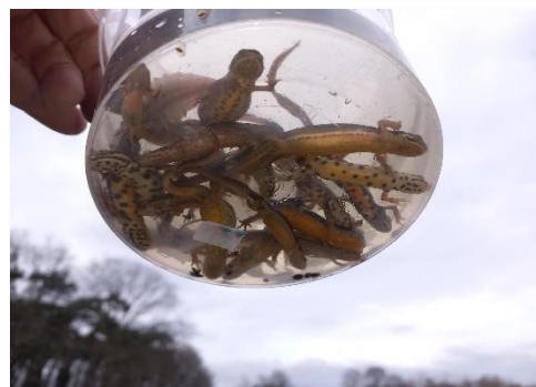
Salamanders tellen.

Een nieuw project om zo veel mogelijk poelen in de gemeente te onderzoeken op de verschillende soorten kikkers, padden en salamanders. Amfibieën hebben het moeilijk door overbemesting, bestrijdingsmiddelen en exotische kreeften. Met behulp van speciale fuiken worden ze gevangen en geteld (en weer losgelaten). Meer inzicht in het voorkomen helpt om betere beschermingsmaatregelen te treffen. En passant wordt ook gekeken naar de grote modderkruiper.