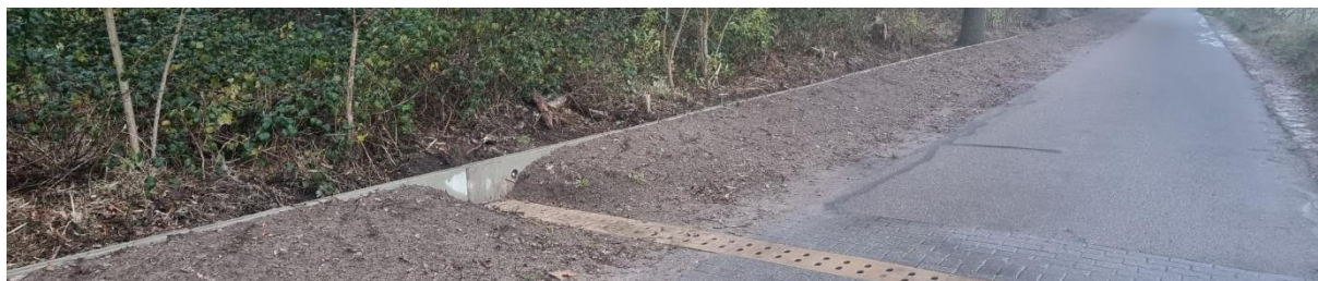
Nieuwe paddenschermen Boskant.

In het najaar heeft de gemeente Wijchen nieuwe betonnen paddenschermen geplaatst aan de Zandbergseweg in het buurtschap Boskant. De oude kunststof schermen werden regelmatig kapotgereden door tractoren en ander groot materieel. Door de betonnen schermen en kleine tunnels kunnen de padden, kikkers en de salamanders veilig onder de weg door naar de overkant.