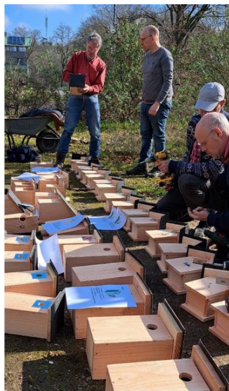
Nestkasten monteren.