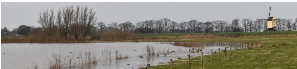
Liendense Waard.

Sindsdien wordt er met enige regelmaat gecontroleerd in het gebied en zijn al diverse overtreders verwijderd.